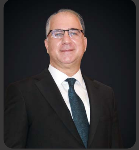
ALPER ÖZEL UND İCRA KURULU BAŞKANI